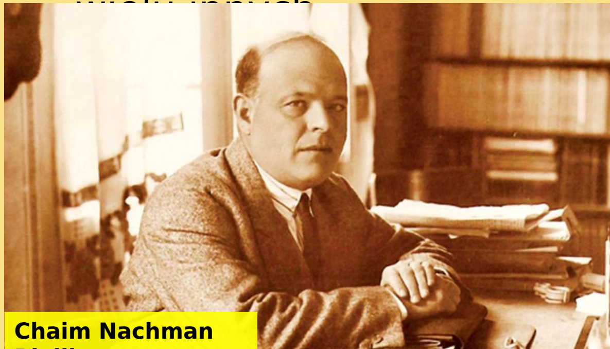
Chaim Nachman Bialik